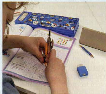
Matematiikan tunnilla opeteltiin harpin käyttöä ja pienen tuen avulla se rupesi sujumaan hienosti.

Kertomuksem päähenkilö on kuitenkin tuo ensimmäinen tyttö. Hän on oivallinen esimerkki siitä, miten pienen näköisistä, lopulta kuitenkin suurista asioista luokan ilmapiiri ja yhteishenki syntyvät: ”Odota, minä tulen auttamaan.”