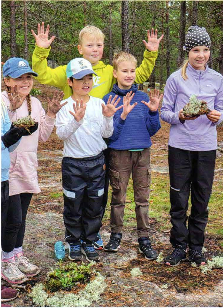
Syvälahden kolmosneloset opettelevat luonnossa muiden huomioon ottamista ja toiminnallista tekemistä. Ulkona on tänä syksynä pidetty myös varsinaisia oppitunteja.

– Olen kouluvaarina samoille lapsille kaksi vuotta. Ensin kolmannella luokalla ja kun he siirtyvät neljännelle, tulevat uudet kolmasluokkalaiset meidän kortteliimme. Joka vuosi siis puolet oppilaista on uusia. Nimien opettelua riittää, Kivelä naurahtaa.